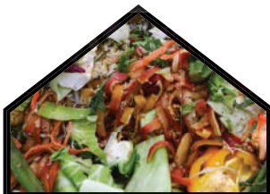
Өрхийн хүнсний хаягдал