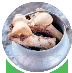
Амьтны гаралтай хаягдлын сав