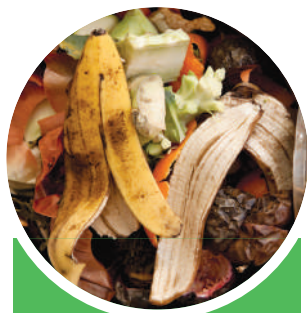
Жимс ногооны хаягдлын сав